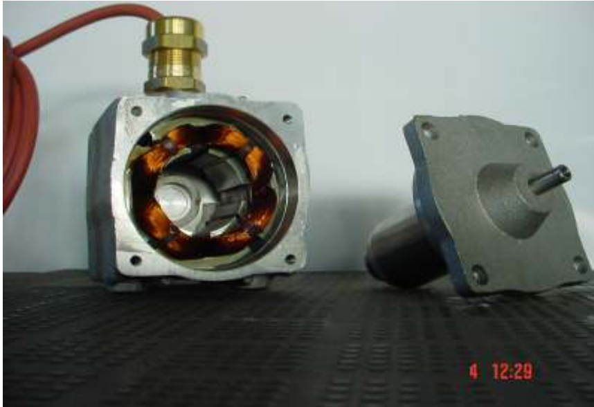
Foto 3 Motore Antideflagrante