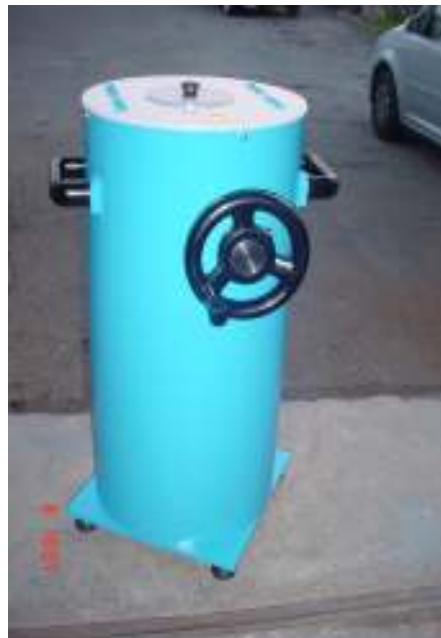
Variatore di fase Trifase da 10 KVA in versione didattica