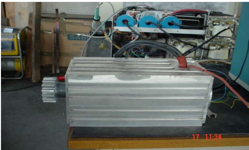
Foto 2 Prototipo di Motore Brushless 10KW 25000 G/'