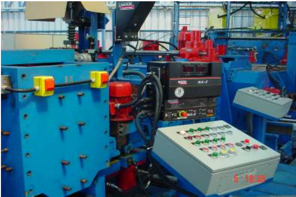
Foto 1 Impianto di formatura e saldatura di tubi